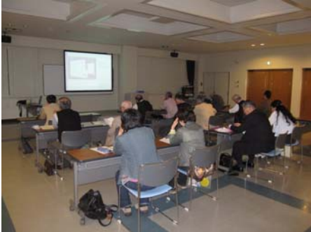
海津市の共同授業