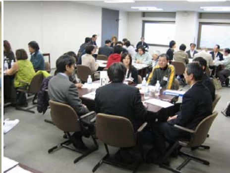
高山市での受講者討論