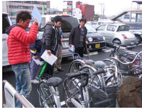
大型ショッピングモー ルの駐輪場の施錠 状態を調査