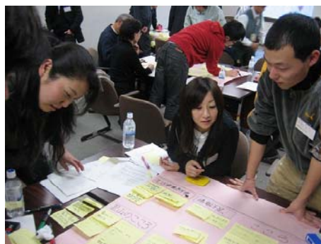
調査内容をもとに ワークショップ