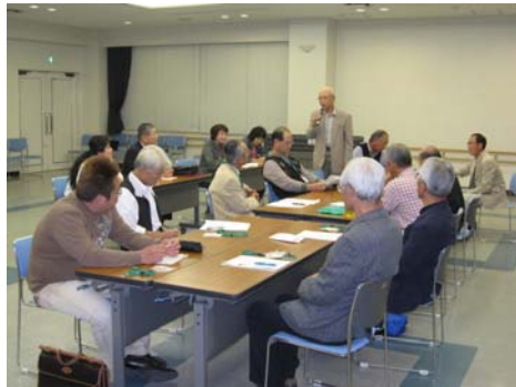
海津市での受講者討論