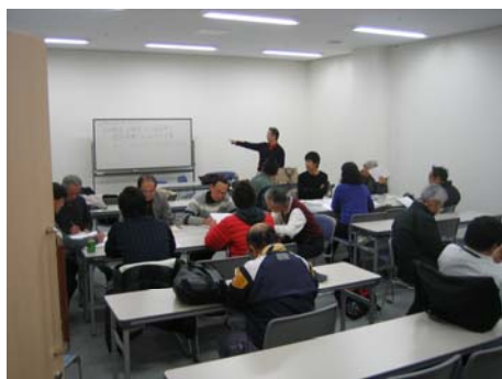
調査したらすぐに、グ ループ単位で調査内 容を検証