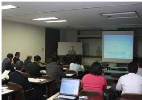
高山市の共同授業