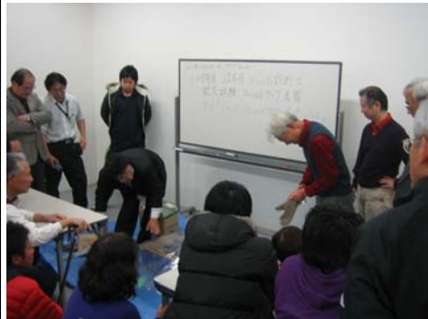
大垣警察署の協力で 防犯ガラスの破壊実 験を体験