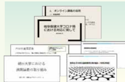
【岐阜県大学・短期大学等一覧】

また、コロナ禍下における大学授業の在り方について、高等学校関係者と大学関係者による意見交換の場を設けることにより、相互に教育の現状の把握・理解をし、高等学校・大学の連携を促進するため、「学びを止めない」ための教育方法＝遠隔授業の実践例＝をテーマとして高大連携セミナーを開催しました。